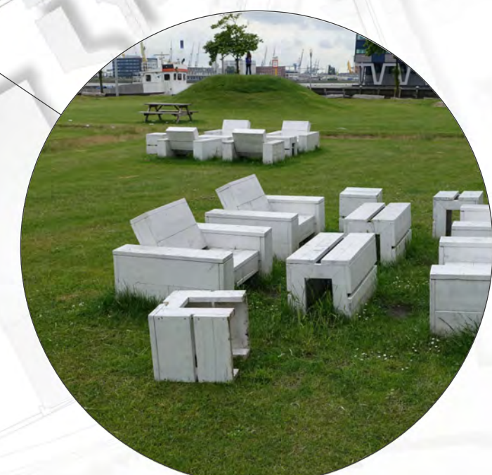
Playground: Mitten im Park liegt die neue Sport- und Liegewiese. Hier kann getobt und gespielt werden.