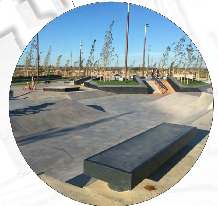
Parcours und Skateanlage